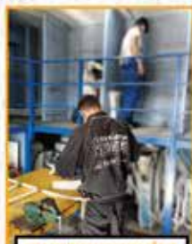
CICLO FORMATIVO DE GRADO BÁSICO DE FABRICACIÓN Y MONTAJE