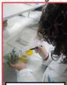
CICLO FORMATIVO DE GRADO MEDIO DE FARMACIA Y PARAFARMACIA (TAMBIÉN MODULOS ONLINE)