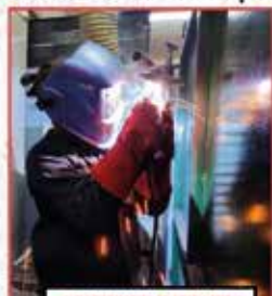
CICLO FORMATIVO DE GRADO MEDIO DE SOLDADURA