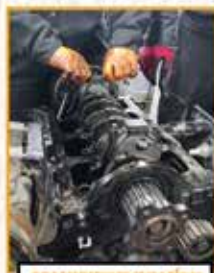
CICLO FORMATIVO DE GRADO BÁSICO DE MANTENIMIENTO DE VEHÍCULOS